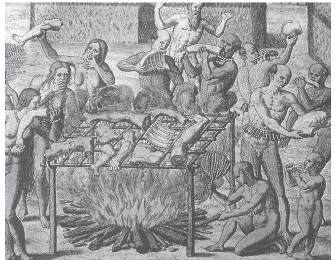
Serie de cobres que ilustra el canibalismo en la Americae Pars Tertia (1592), de Theodor de Bry. Ilustra el relato de Johannes Staden von Homber.